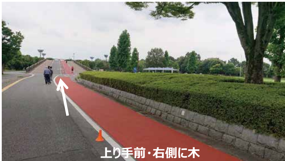
上り手前・右側に木