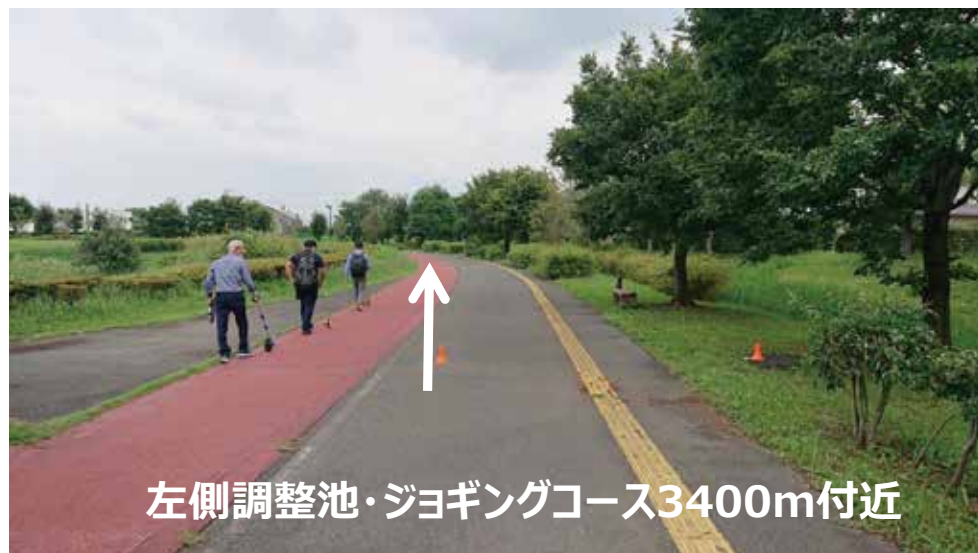
左側調整池・ジョギングコース3400m付近