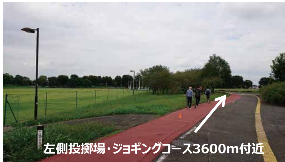
左側投擲場・ジョギングコース3600m付近